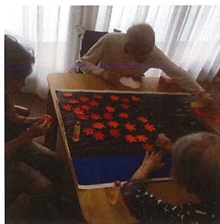
ご利用者様に季節の飾りを作っていました