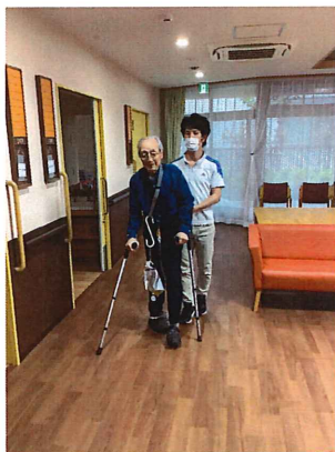
個別機能訓練の実施風景