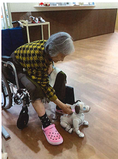
Aibo とのスキンシップ